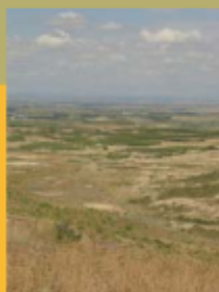
Val de Pinos

Distancia: 10 km (desde la Casa Forestal hasta la Punta de la Negra y vuelta), 19,5 km desde la carretera de Valareña (ida y vuelta).