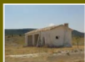
Refugio de Goya