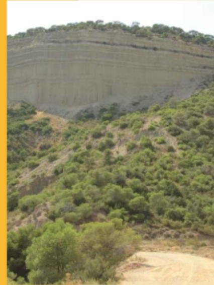
Escarpe vetical en la Bardena Aragonesa