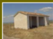
Refugio de Florián