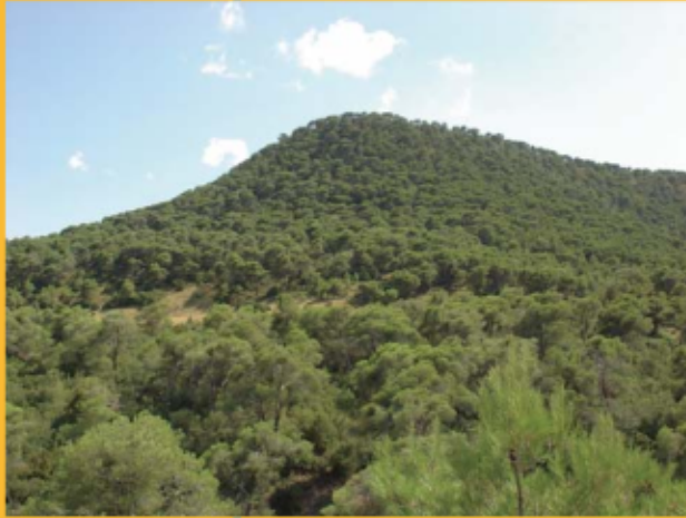
Punta de La Negra

Bardena comprende varios Montes de Utilidad Pública, y están gestionados por la administración forestal. El entorno de los montes de la Bardena Aragonesa está considerado como Zona de Especial Protección para las Aves (ZEPA), en los enclaves naturales compuestos por humedales, carrizales y loma o plataforma de La Negra; y también como Lugar de Importancia Comunitaria (LIC) en el entorno de la Loma Negra (cortados que delimitan las plataformas, superficies compuestas por pinares, etc). Es un territorio de gran interés ecológico