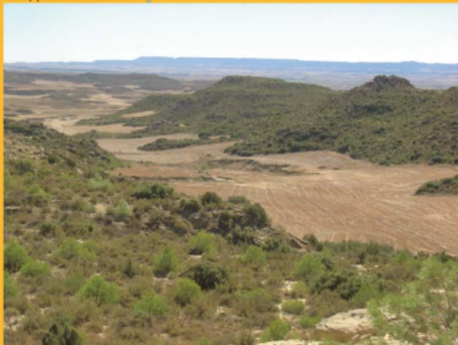
Vales y pinares de la Marcuera

Monte de Utilidad Pública de 1.100 hectáreas, perteneciente al ayuntamiento de Ejea de los Caballeros. Ha sido un monte muy degradado debido al pastoreo, pero en los últimos diez años se ha realizado una gran labor de repoblación forestal (800 ha). La especie que se ha utilizado en la reforestación ha sido, sobre todo, el pino carrasco ( Pinus halepensis ). La reconstrucción de tres refugios y el acondicionamiento de los caminos, han convertido a esta zona en frecuentado destino de actividades lúdicas (caza, senderismo, BTT...).