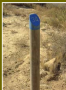
Baliza de kilometraje