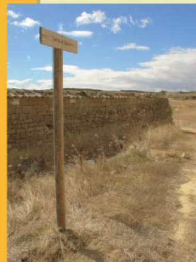
Corral de Narro